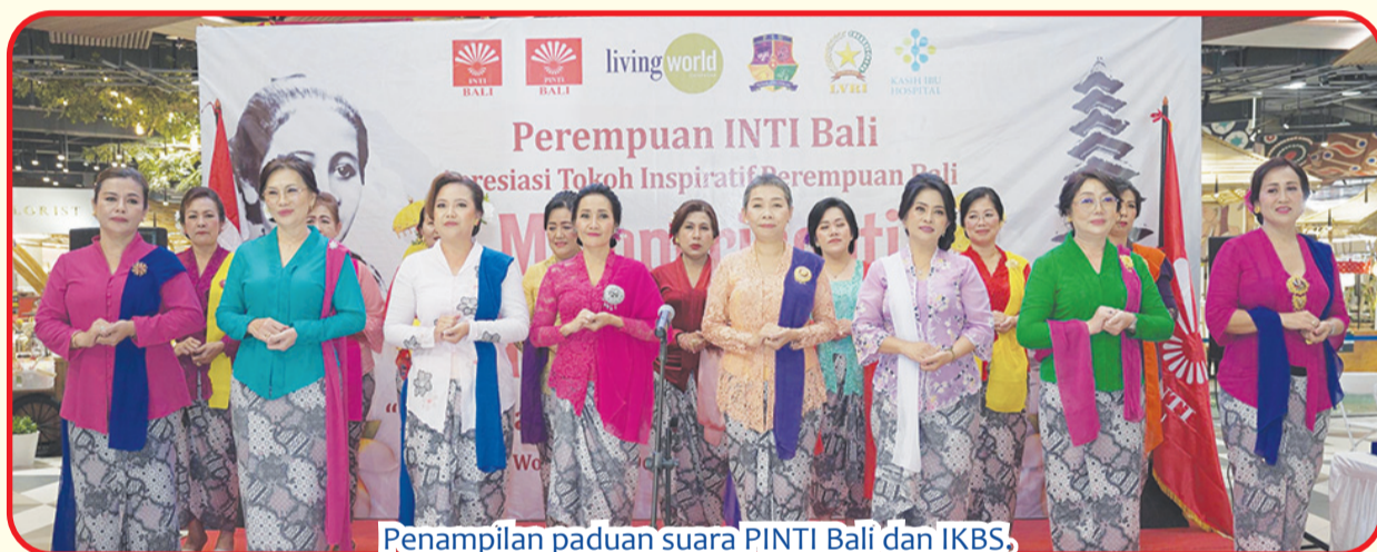
Penampilan paduan suara PINTI Bali dan IKBS.

Karena itu harus semangat bergerak sesuai bidang yang ditekuni kaum perempuan itu sendiri. • si-ks