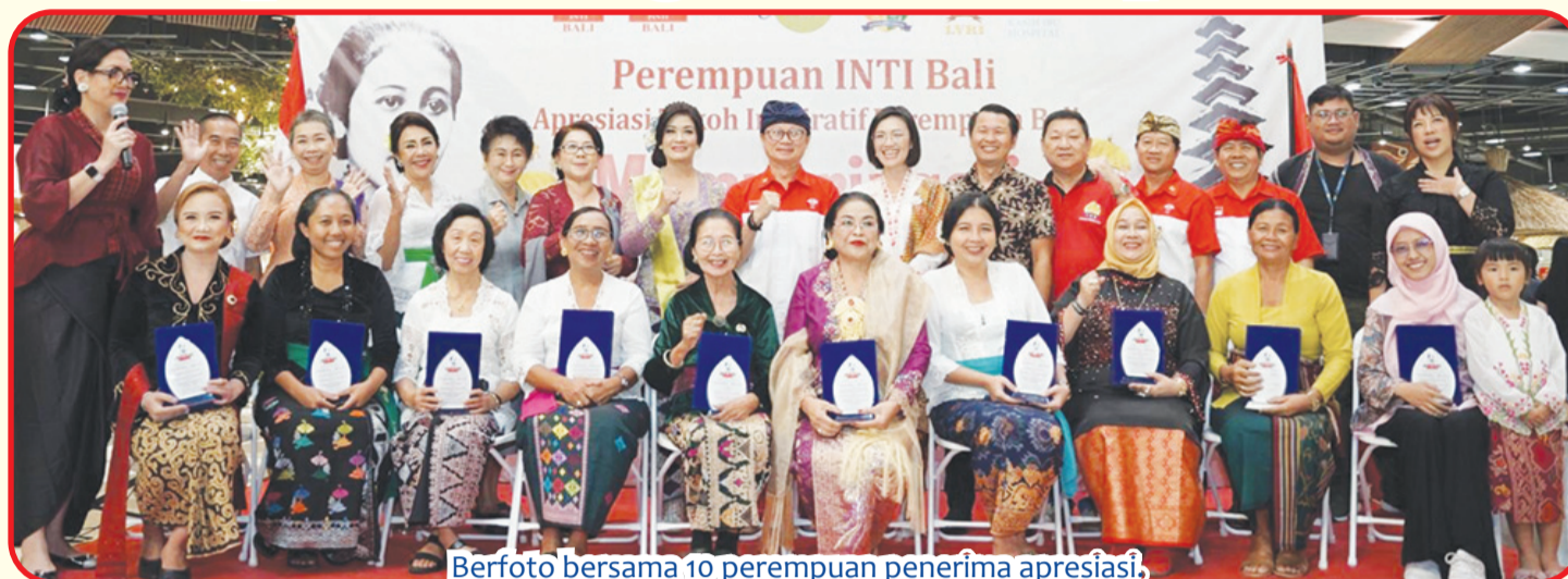
Berfoto bersama 10 perempuan penerima apresiasi.