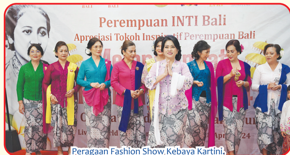
Peragaan Fashion Show, Kebaya Kartini.