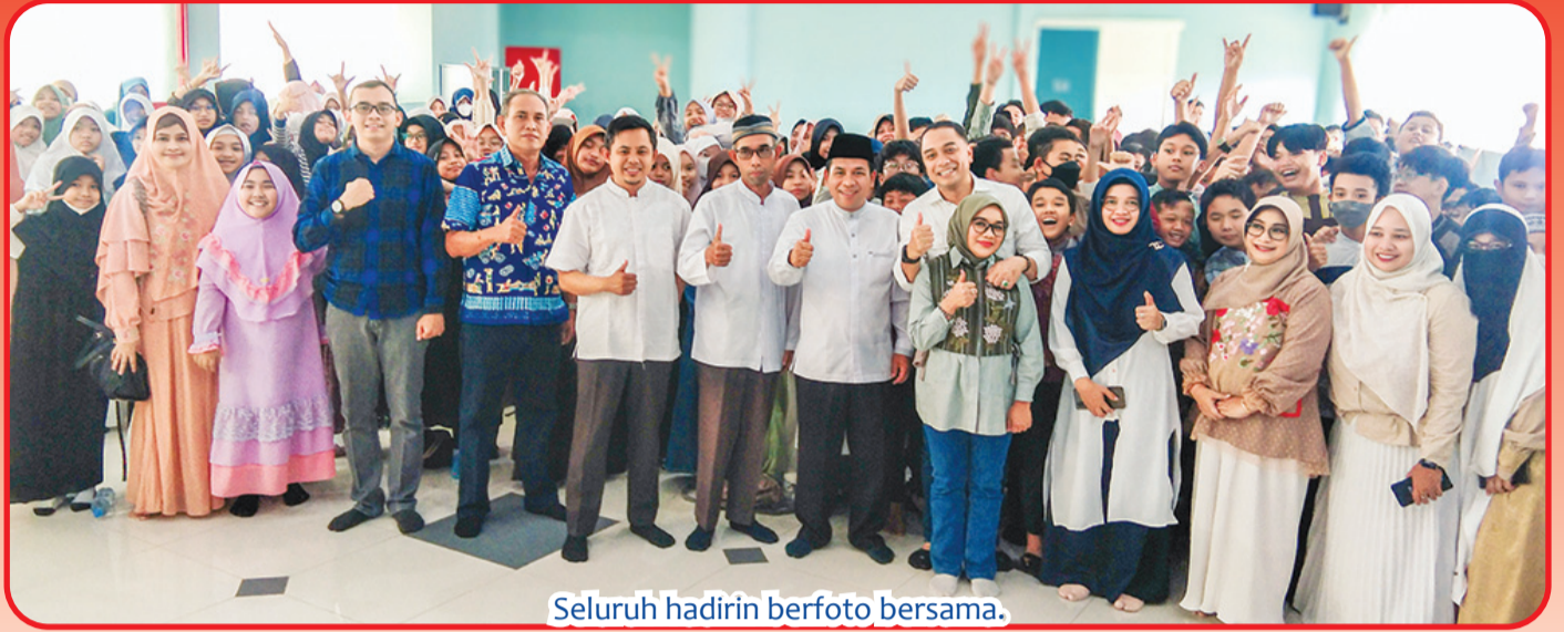
Seluruh hadirin berfoto bersama.

SURABAYA (IM) - Wali Kota Surabaya Eri Cahyadi memberikan motivasi dan semangat kepada ratusan siswa SD Muhammadiyah 4 (Mudipat) Surabaya, Sabtu (4/5).