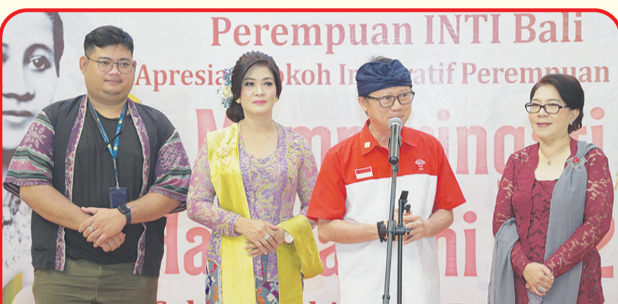
Ketua Harian INTI BALI didampingi Ketua PINTI, ketua panitia dan perwakilan Living World, membuka acara.